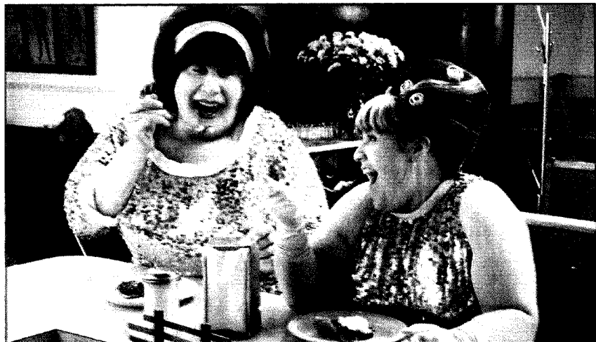
John Travolta travestito da ricalca in una grottesca scena del film "Hairspray"